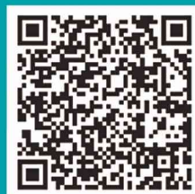
东莞社保智能客服